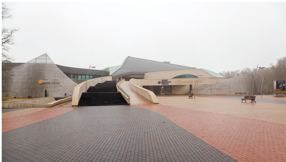
Рис. 2. Морской выставочный центр Музея Мирового океана в Светлогорске. Fig. 2. Maritime Exhibition Center of the Museum of the World Ocean in Svetlogorsk.

Морской выставочный центр Музея Мирового океана. Морской выставочный центр в Светлогорске (рис. 2) – единственный объект Музея Мирового океана, расположенный непосредственно на побережье Балтийского моря. Центр открылся в 2015 г. в здании комплекса «Янтарь-холл» и включает в себя почти 3000 кв. м экспозиционных площадей. Теперь там действует постоянная этнографическая экспозиция «Люди моря», знакомящая с бытовыми и культовыми предметами и с произведениями декоративно-прикладного искусства народов Юго-Восточной Азии, а также открываются различные временные выставки, имеющие художественно-историческую направленность и посвящённые различным аспектам этнографии и истории географических открытий.