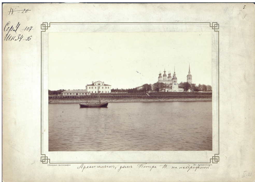
Рис. 4. Архангельск. Дом Петра Великого на набережной. Fig. 4. Arkhangelsk City. House of Peter the Great on the embankment.

правильное описание правой части кадра: «В правой половине кадра – храмовый комплекс на бывшей территории Михайло–Архангельского монастыря (ныне Петровский парк). У края кадра, ближе к воде – Церковь Михаила Архангела, построенная между 1742 и 1749 гг. и разобранная в 1932 г. За ней – Свято-Троицкий кафедральный собор с колокольней, построенный между 1709 и 1765 гг. и уничтоженный в 1929 г.» [6, с. 9].