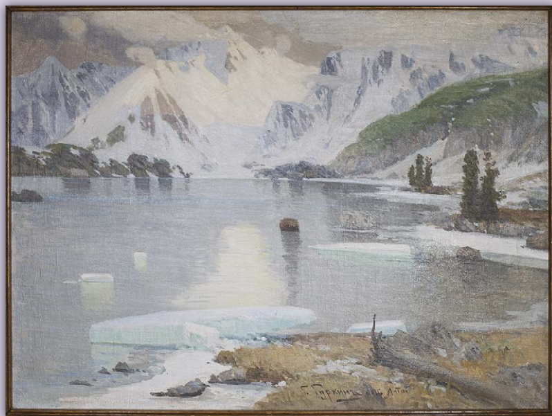
Григорий Чорос-Гуркин. «Алтай» («Озеро горных духов»), 1916.