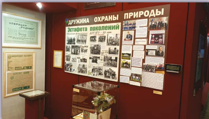
Фрагмент выставки в Воронежском областном краеведческом музее.