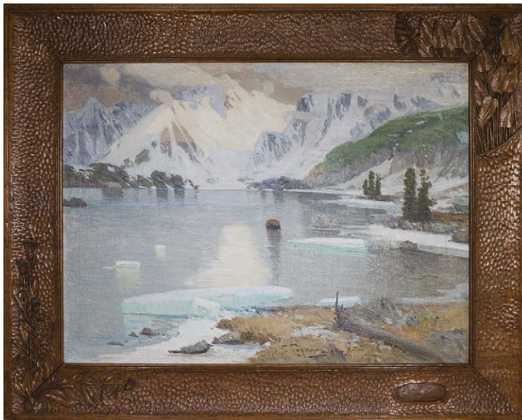
Рис. 3. Григорий Чорос-Гуркин. «Алтай» («Озеро горных духов»), 1916. Художественная коллекция Санатория «Узкое».

Именно с Томском и авторским повтором одного из лучших произведений Г.И. Чорос-Гуркина «Озеро горных духов» будет связана история создания картины «Алтай», хранящейся сегодня в «Узком» (рис. 3). Произведение датировано автором 1916 годом, однако в некоторых исследованиях его создание относили к 1915-му, сопригая с визитом Н.А. Морозова и его супруги Ксении Алексеевны в этот город [11]. В рамках данной статьи, на основании вновь выявленных архивных материалов, мы постараемся внести некоторые коррективы в историю с этим поистине бесценным даром, сделанным чете Морозовых.