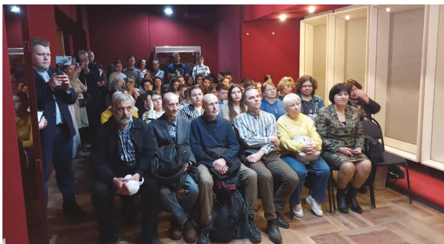
Рис. 1. На открытии выставки 24 марта 2023 г. Fig. 1. At the opening of the exhibition, March 24, 2023.

В связи с этим настоящей публикацией попытаемся в некоторой степени восполнить пробелы истории природоохранных институтов в нашей стране, и прежде всего общественных, нашедших своё отражение в выставке Воронежского областного краеведческого музея «Молодёжь на страже природы», посвящённой 50-летию Дружины охраны природы Воронежского государственного университета (ДОП ВГУ) и студенческого природоохранного движения в Воронеже, которая прошла с 24 марта по 5 июня 2023 г. (рис. 1, 2а,б). Предполагается, что выставочная экспозиция ещё будет демонстрироваться в других музеях Воронежа.