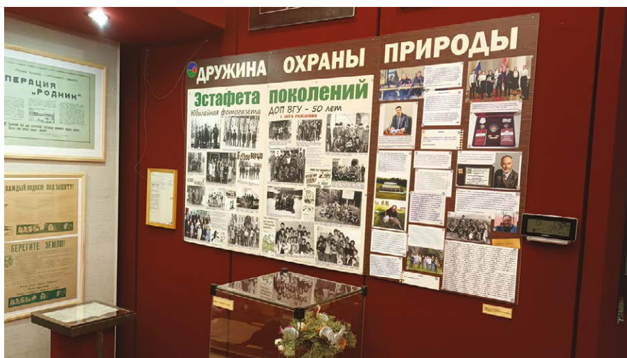
Рис. 3. Часть экспозиции выставки со стендами, воспроизводящими информационно-коммуникационную доску ДОП ВГУ 1980-х гг. со стенгазетой «Эстафета поколений» и ряда информационных и рабочих объявлений.

За время работы выставки в Воронежском областном краеведческом музее её посетило около 6 тысяч человек.