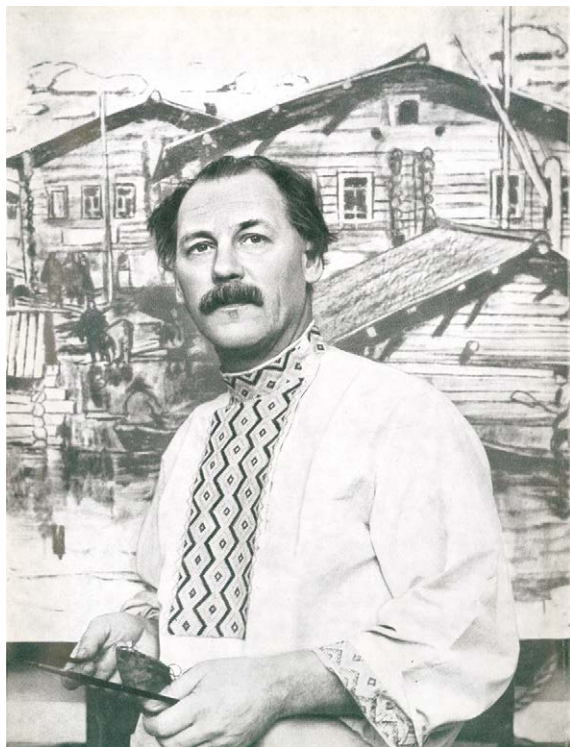
Рис. 1. Владимир Фёдорович Стожаров, 1972 (?) [8]. Fig. 1. Artist Vladimir F. Stozharov, 1972 (?) [8].

Биография В.Ф. Стожарова. Владимир Фёдорович Стожаров (рис. 1) родился 3 января 1926 г. в Москве. Отец его, по профессии шофёр, привил мальчику вкус к поездкам (забегая вперед, заметим, что любовь к путешествиям осталась у Стожарова на всю жизнь, отразившись на его творчестве). Мать была художником-любителем, старший брат серьёзно занимался живописью – не случайно склонность к рисованию у Володи проявилась ещё в детстве. Твёрдое решение посвятить себя живописи сформировалось у него после знакомства с жившим по соседству художником И.С. Копиным, который стал его первым учителем.