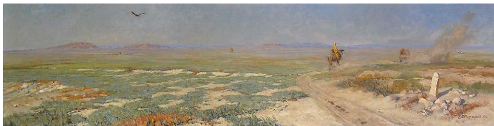
Рис. 6. Пенеплен Центрального Казахстана. 1955. 90×360. Холст, масло. Музей земледелия МГУ. ОФ 626.

Картина «Пенеплен Центрального Казахстана» (рис. 6) изображает широкую, выжженную на солнце степь, окаймлённую вдали отдельными массивами невысоких сопок. Слева уходит за поворот степная дорога, по ней идёт верблюд, на котором восседает человек в национальной казахской одежде. Ещё дальше просматривается силуэт машины, которая перемещается по той же дороге. Вот, пожалуй, и весь сюжет. Колорит выдержан в сдержанной охристой гамме. Однако картина не производит впечатления блёклой и ничем не примечательной: с помощью белёсых, пастельных тонов Стожарову удалось передать наполненное обжигающим воздухом пространство, раскалённое полуденное марево. В композиции картины все элементы уравновешены. Даже пыль, развеваемая ветром из-под ног верблюда и колёс автомобиля, создаёт ощущение движения.