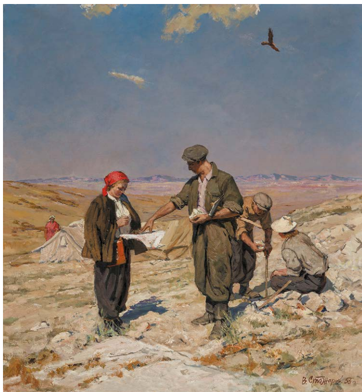
Рис. 7. Геологи в Казахстане. 1955. 110×100. Холст, масло. Музей землеведения МГУ. ОФ 627. Fig. 7. Geologists in Kazakhstan. 1955. 110×100 cm. Oil on canvas. Earth Science Museum, Moscow State University. Main collection, 627.

Теперь переходим к полотну «Геологи в Казахстане» (рис. 7). На картине мы видим четырёх геологов. Мужчина в кепке, помещённый в центр композиции, – скорее всего, начальник этой геологической партии: его вполне можно представить в университетской