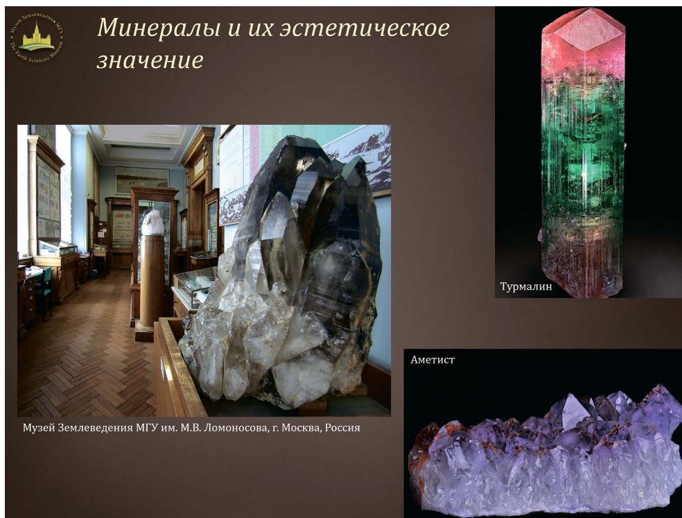
Музей Землеведения МГУ им. М.В. Ломоносова, г. Москва, Россия

Рис. 5. Пример слайда из презентации по теме 4 «Роль минералов в жизни человека», иллюстрирующий эстетическое значение минералов.