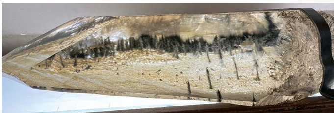
Рис. 3. Кристалл кварца, Приполярный Урал. Образец из коллекции основного фонда Музея землеведения МГУ.

Fig. 3. Quartz crystal, Subpolar Ural. Sample from the main collection of the Earth Science Museum, Moscow State University.