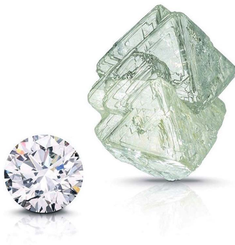
Рис. 4. Алмаз и бриллиант, Южная Африка.

Курс чётко структурирован в рамках тем, каждая из которых состоит из нескольких взаимосвязанных разделов, обеспечивающих доступное освоение дисциплины и изучение материалов при значительно меньших временных затратах. В цикл онлайн-занятий включены все необходимые материалы для достижения результатов обучения. Лекционные материалы представляют систематизированное изложение основных вопросов курса в формате онлайн-занятий с преподавателем, сопровождающихся красочными презентациями и непрерывным взаимодействием лектора