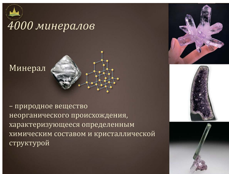
Рис. 2. Пример слайда из презентации по теме 1 «Введение», иллюстрирующий общее представление о минералах.

На втором занятии слушатель знакомится со строением Земли, минералами, характерными для её основных слоёв: земной коры, верхней, нижней мантии и ядра. На занятии рассматриваются основные минералы земной коры – кварц и его разновидности ( рис. 3 ), а также ценные минералы – драгоценные камни первого порядка: рубин, сапфир, alexandrit. Слушатели могут непосредственно увидеть образцы из коллек-